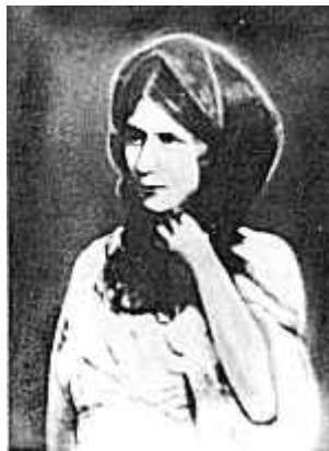
Мать в Алжире в 1903-05