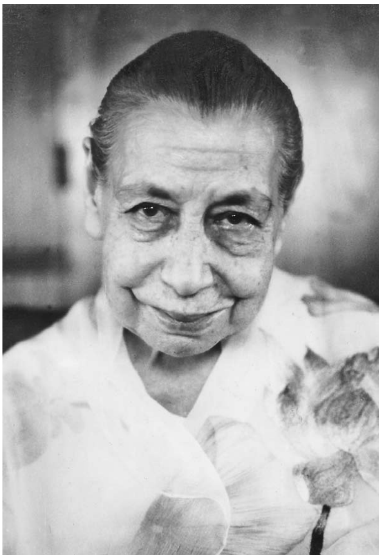
La Mère en 1969